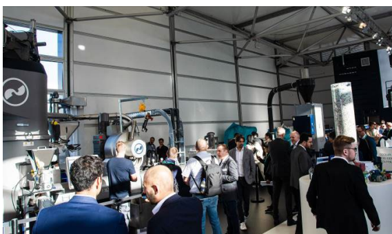
Die täglichen Live-Recyclingvorführungen und die Ausstellung mit rund 70 Endprodukten aus Regranulat machten das EREMA Circonomic Centre zum Besuchermagneten auf der diesjährigen K.